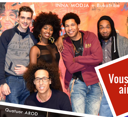
INNA MODJA + Bukatrise

Parmi les lieux culturels de la ville de Tremblay-en-France, L'Odéon réunit depuis 2002 la Scène JRC et le Conservatoire à Rayonnement Communal. Il propose à la fois une programmation musicale permettant la rencontre avec des artistes émergents ou confirmés, mais aussi un enseignement de la musique et de la danse. Cette riche cohabitation entre association et service municipal permet à la Scène et au Conservatoire d'offrir au public une programmation musicale éclectique : musique classique et musiques actuelles, blues et chanson française, jazz et musiques du monde. Une déclinaison de sa programmation est aussi proposée au jeune public avec une sélection de spectacles musicaux ludiques et éducatifs. Dans la lignée de la politique culturelle tremblaysienne, L'Odéon apporte tout son soutien à la promotion de la scène musicale émergente par le biais de dispositifs d'accompagnement et de résidences artistiques. Enfin des actions culturelles locales favorisent l'échange et la découverte des pratiques musicales, la rencontre entre les publics et les artistes. Afin d'élargir son rayonnement, L'Odéon collabore notamment avec le cinéma Jacques Tati et le théâtre Louis Aragon ; l'association Scène JRC adhère aussi au Réseau Musiques Actuelles MAAD93.