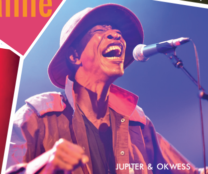
JUPITER & OKWESS