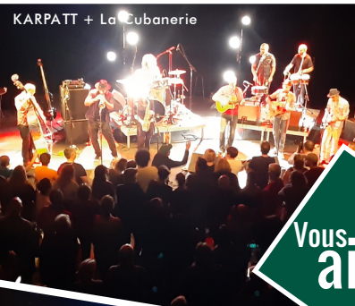
KARPATT + La Cubanerie