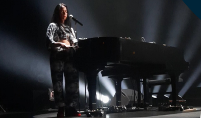
CONCERT LA CHICA