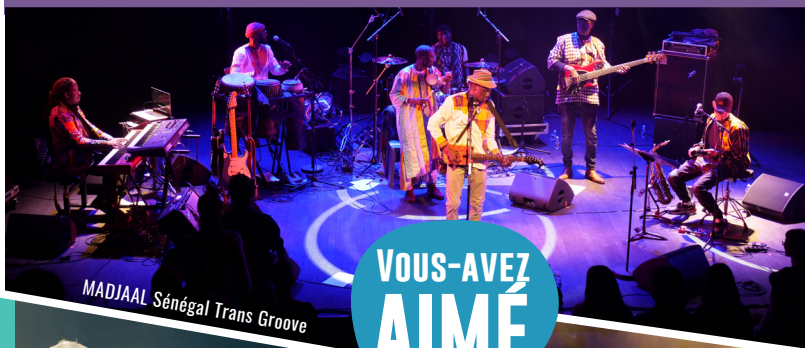
MADJAAL Sénégal Trans Groove