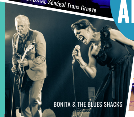
BONITA & THE BLUES SHACKS