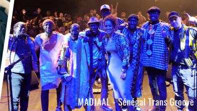
MADJAAL Sénégal Trans Groove