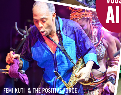
FEMI KUTI & THE POSITIVE FORCE